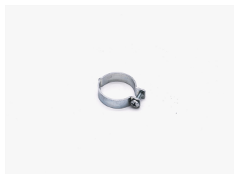
Fascetta Zincata Monovite MEC90