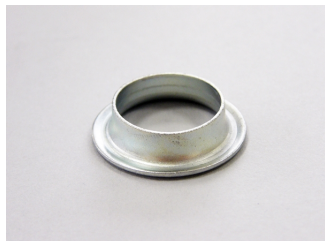
Anello Zincato MEC71