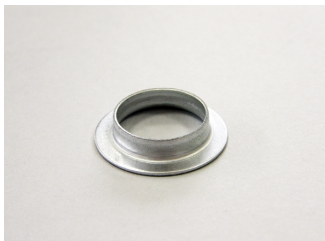
Anello Zincato MEC63/71