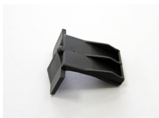
Staffa Blocca Condensatore