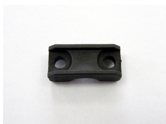
Fermacavo MEC63/71 - UL-94 V0