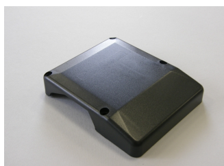
Coperchio per base portacondensatore modello E4