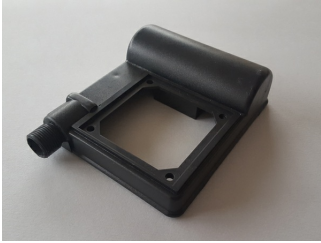
Base Portacondensatore MEC56/63/71 modello M2