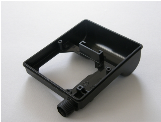
Base Portacondensatore MEC56/63/71 modello M2