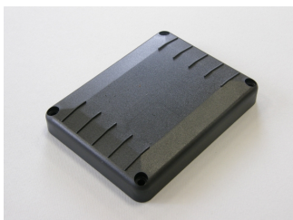
Coperchio per base portacondensatore modello E3