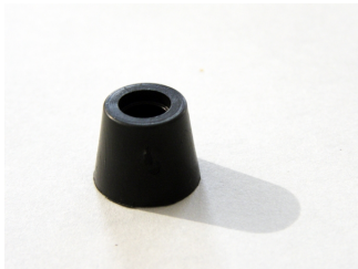
Guarnizione Conica MEC90