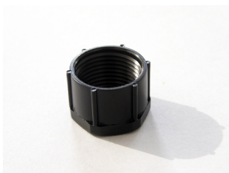
Ghiera di Fissaggio